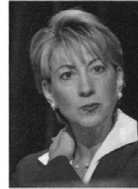
Carly Fiorina, ceo di Hewlett-Packard. Con altri ceo di grandi aziende è nel comitato della Information and communication task force dell'Onu

Per Pistorio la missione umanitaria si trasforma in un miglioramento dei rapporti interni e, in definitiva, dell'efficienza e della produttività dell'organizzazione-impresa soprattutto in una fase di transizione come quella attuale. E.T.